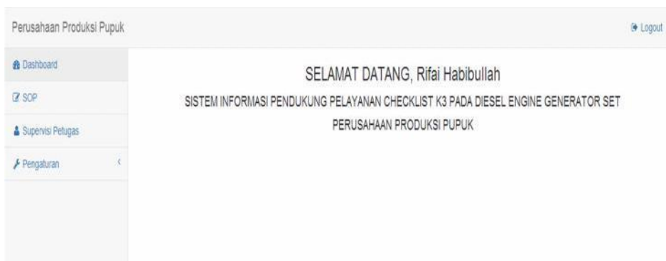
Gambar 3. Halaman Utama Menu Supervisor