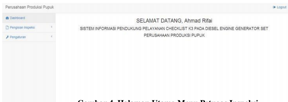
Gambar 4. Halaman Utama Menu Petugas Inspeksi

Pada menu Petugas Inspeksi dapat terlihat menu apa saja yang terdapat pada halaman pertama setelah Login ( Dashboard ) Petugas Inspeksi yaitu menu Pengisian Inspeksi, Pengaturan Ganti Password . Masing-