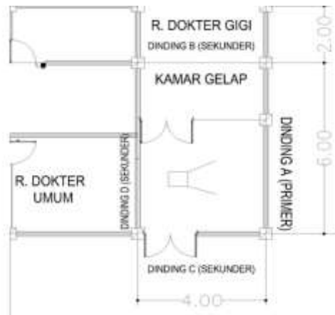
Gambar 1.1 Denah ruangan pesawat sinar-x di PSTA BATAN Yogyakarta (2016)

Pada ruangan denah pesawat sinar-x diletakkan pada suatu ruangan yang dahulu digunakan untuk lab.sementasi dimana berbatasan dengan ruang evaporasi yang saat ini digunakan untuk ruang dokter umum dan gudang limbah yang saat ini digunakan untuk ruangan dokter gigi, dan dinding lain langsung bersebelahan dengan lingkungan masyarakat langsung. Untuk dinding-dinding tembok berupa dinding bata berplester setebal 18 cm (15 cm bata dan 3 cm plesteran) dengan luas ruangan 6 m x 4 m dan tinggi langit-langit setinggi 3 m .Denah ruang pesawat sinar-x seperti gambar 1.1, sebagai berikut: