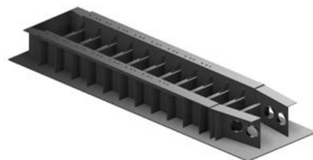
Gambar 2 Pemodelan 3D Pondasi Mesin Induk

Pemodelan pondasi mesin induk Kapal Tanker 6500 LTDW yang dibangun di PT Dok Perkapalan Surabaya. Mesin induk akan ditopang oleh 2 plat memanjang dan 12 plat melintang. Plat melintang akan berda di frame 16 sampai dengan frame 28. Dapat terlihat pada gambar 2: