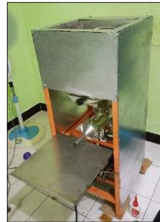
Gambar 3 Hasil Pembuatan Mesin

Tahapan setelah proses fabrikasi komponen mesin selesai adalah proses perakitan dan pengecatan. Tahap tersebut adalah tahap akhir dari pembangunan mesin pengaduk dan pencetak adonan gethuk pisang ini. Hasil pembuatan mesin dapat dilihat pada Gambar 3.2 berikut ini: