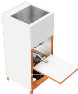
Gambar 2 Konsep Desain Terpilih

Berdasarkan Tabel 2 di atas konsep desain yang mendapat ranking terbaik adalah konsep desain 1. Konsep desain 1 dapat dilihat pada Gambar 2 berikut: